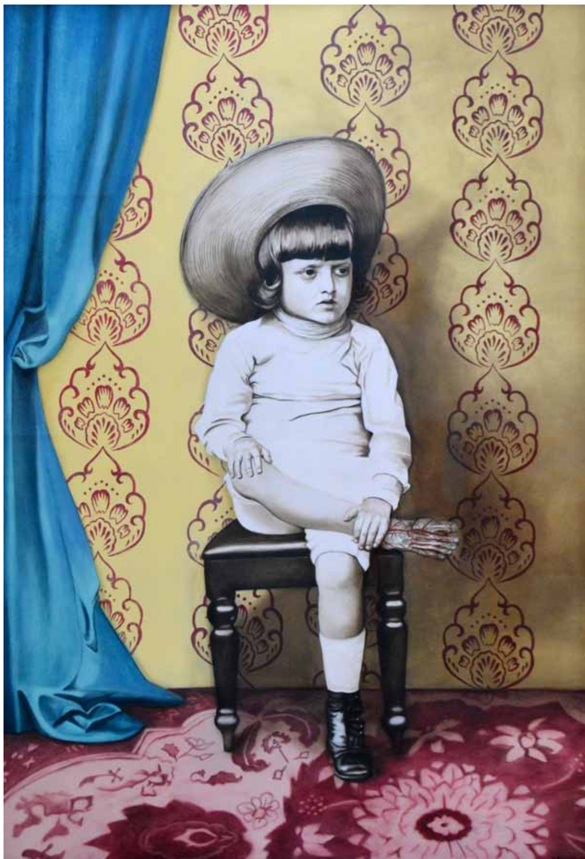
Boy with flayed foot / Chlapec se staženou z kůže nohou, 2006

oil on canvas / olej na plátně 129,5 x 89 cm