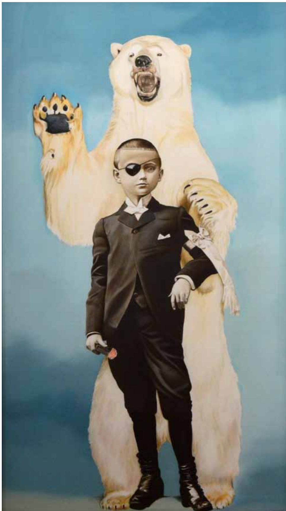
Boy with bear / Chlapec s medvědem, 2007

oil on canvas / olej na plátně 199 x 109 cm