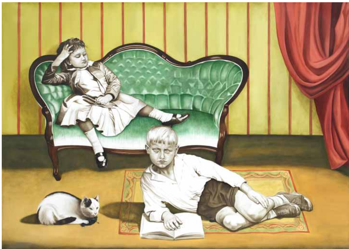
Living Room Painting / Obrázek z obývacího pokoje, 2015

oil on canvas / olej na plátně 152,5 x 213 cm