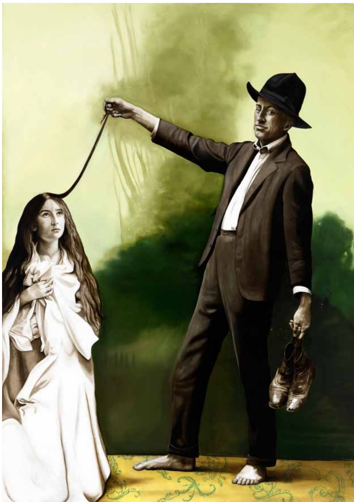
Vorsicht! A Vampire might steal your shoes / Pozor! Upír může ukrást vaše boty, 2011

oil on canvas / olej na plátně 213 x 152 cm