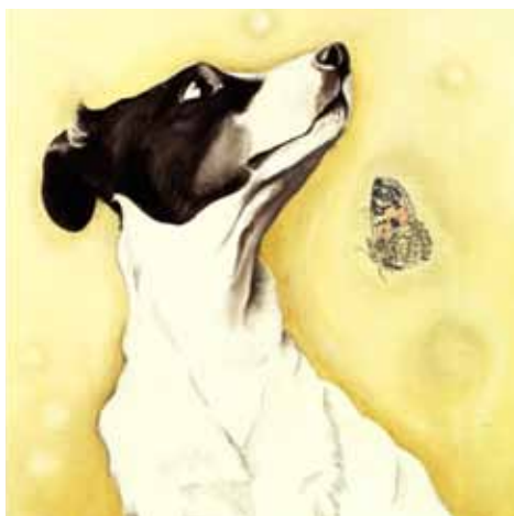
Dog with butterfly / Pes a motýl, 2008