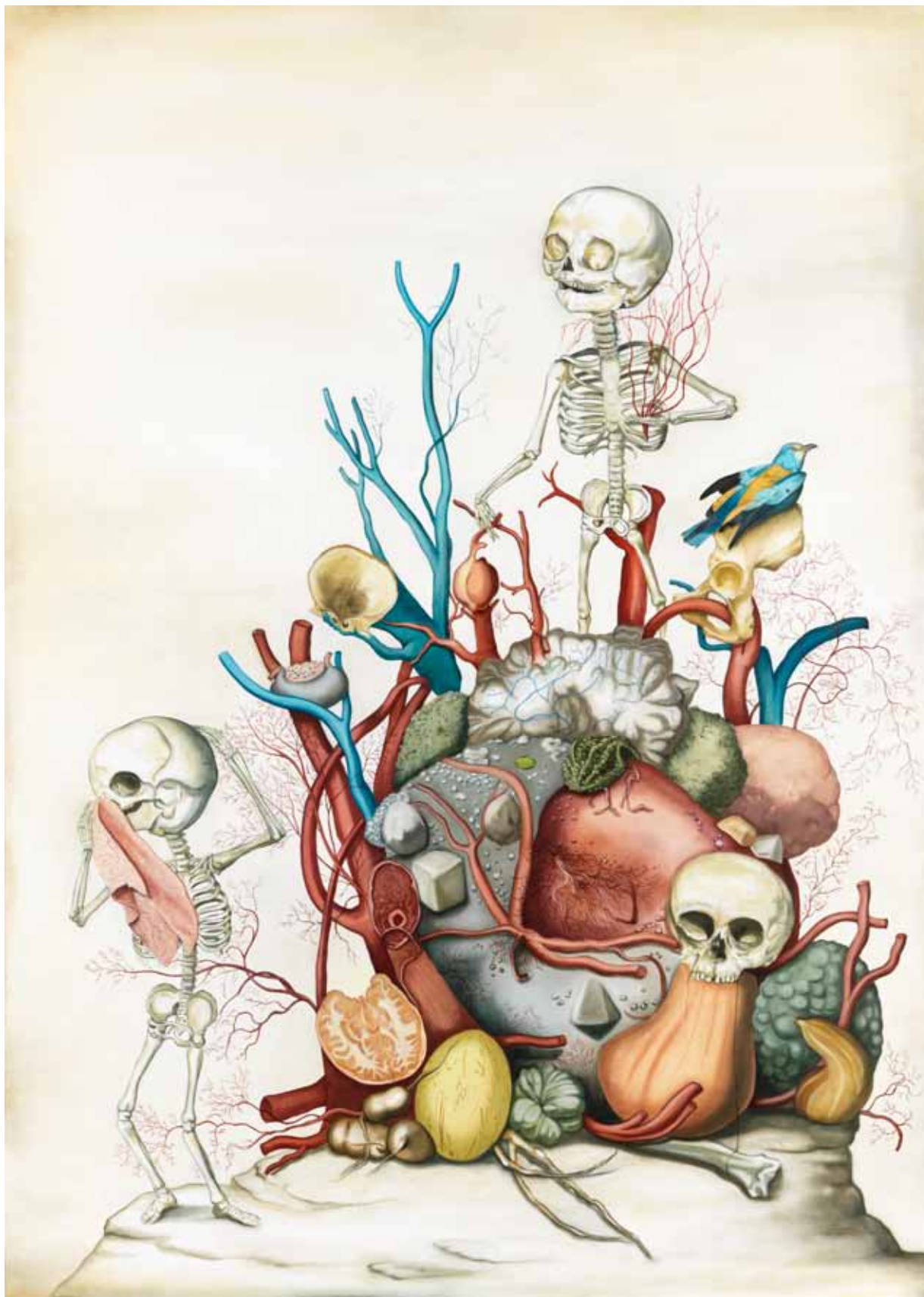
White Noise / Bílý hluk, 2013

oil on canvas / olej na plátně 212,5 x 152 cm