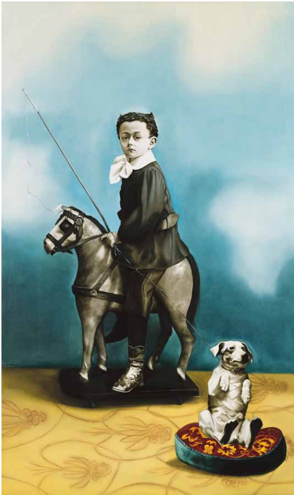
Bad Friedrich / Zlý Bedřich, 2008

oil on canvas / olej na plátně 200 x 120 cm