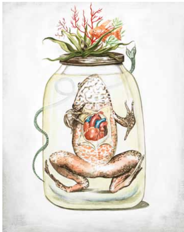
Frog in Jar / Žába v zavařovací sklenici, 2013

oil on wood / olej na dřevě 50,7 x 40,3 cm