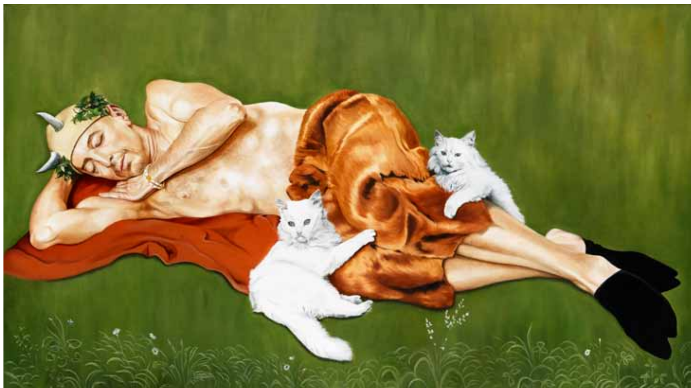
Sleeping Satyr with cats / Spící Satyr s kočkami, 2012

oil on canvas / olej na plátně 137 x 244 cm