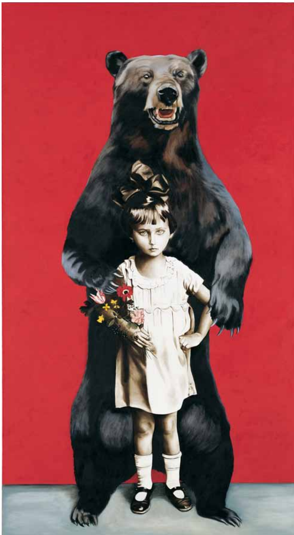
Girl with bear / Dívka s medvědem, 2007

oil on canvas / olej na plátně 199 x 109 cm