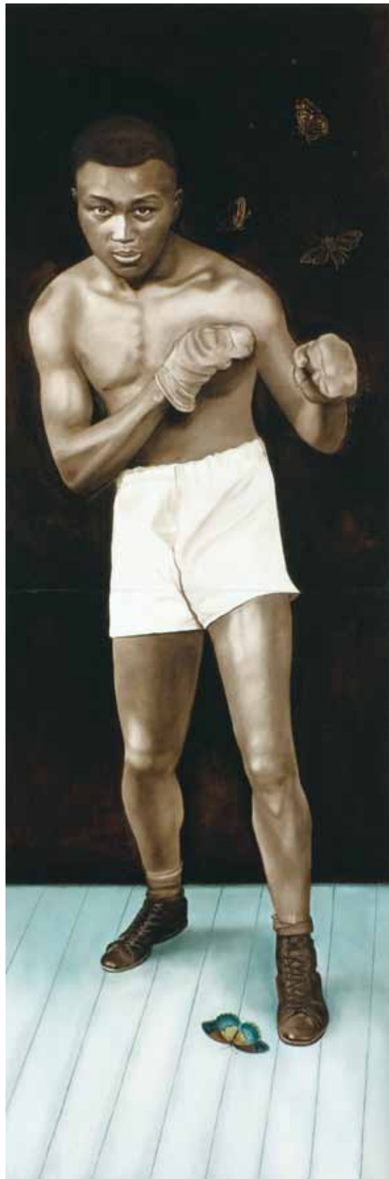
Black & White Boxer #1 and Black & White Boxer #2 / Černý a bílý boxer č. 1 & Černý a bílý boxer č. 2, 2010

oil on wood, two pieces / olej na dřevě, dva kusy 183 x 122 cm