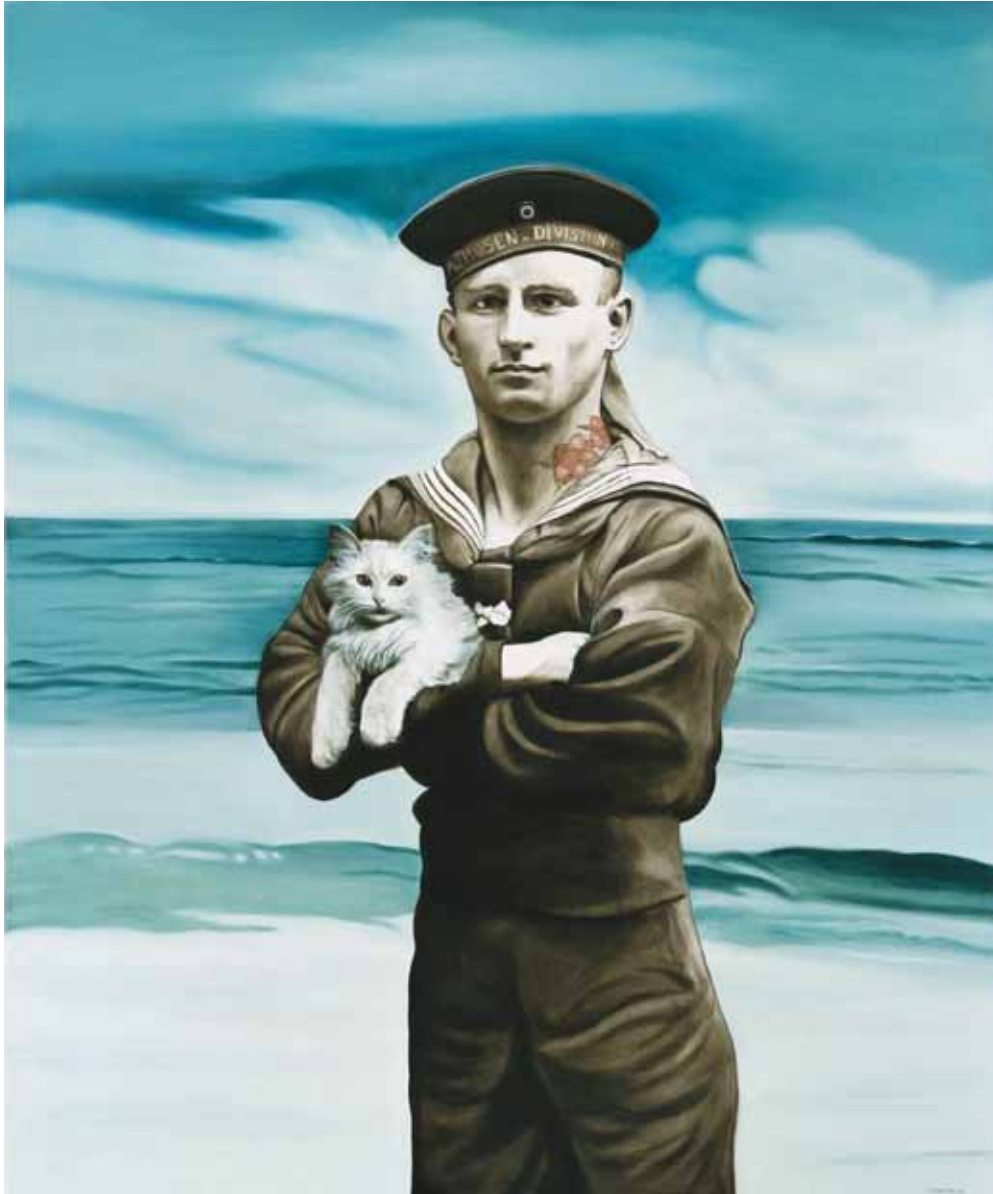
Sailor with half cat / Námořník a půl kočky, 2008

oil on canvas / olej na plátně 120 x 100 cm